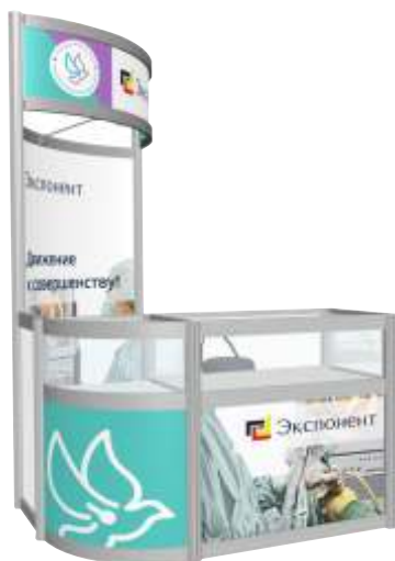
Стенд с витриной