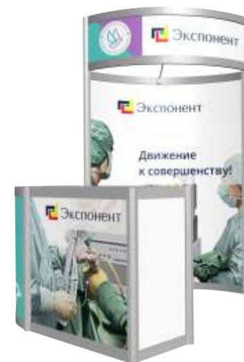
Стенд со стойкой ресепшна